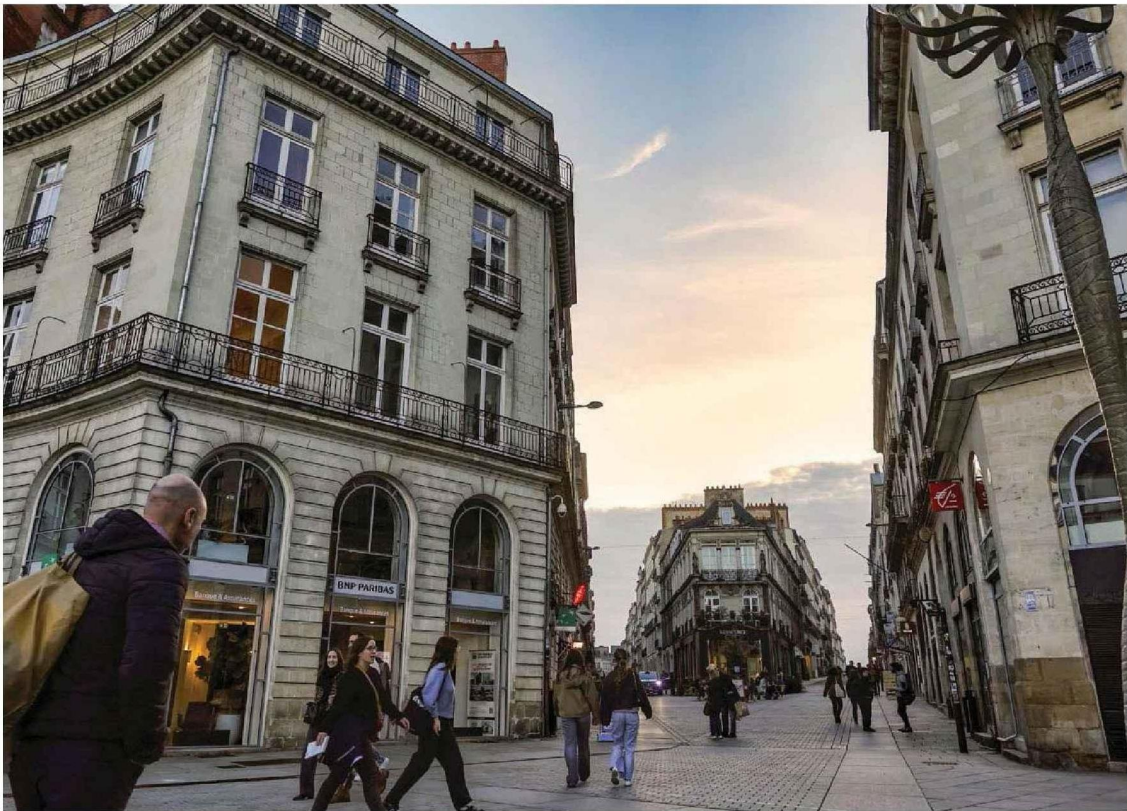
Temps d'arrêt. Les appartements du centre-ville, comme ici rue Voltaire, voient leurs ventes stagner depuis la fin du confinement.

Immobilier. La chute des prix et des transactions ralentit un peu.