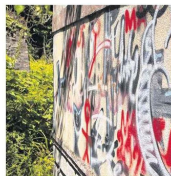
Des petits malins ont investi le jardin de la demeure afin de peindre sur ses murs. Cela fait désormais partie de l'histoire du bien.