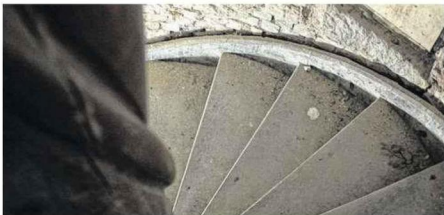
L'escalier de la demeure peut être enlevé afin d'être restauré entièrement. Anne-Sophie Matrat