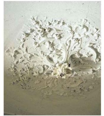
Au plafond subsistent de belles moulures qui ne demandent qu'à être rénovées pour retrouver tout leur éclat. Anne-Sophie Matrat