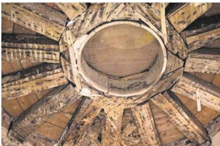
Au-dessus de l'escalier de la demeure, un plafond tout à fait atypique est un véritable attrait pour les éventuels acquéreurs du bien. Anne-Sophie Matrat