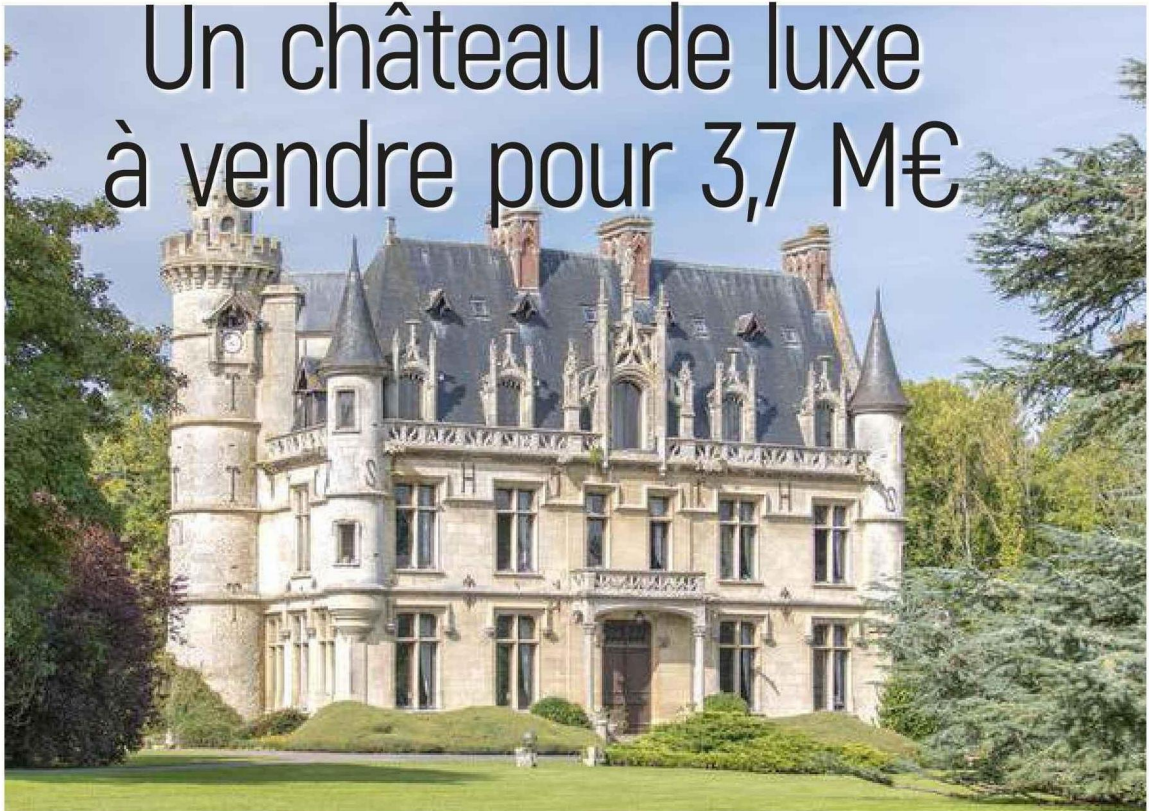
Le château est entouré par un parc de 27 hectares

À Vexin-sur-Epte, près de Vernon, un château néogothique du XIX e siècle avec aérodrome privé est à vendre. Son prix : 3,7 millions d'euros.