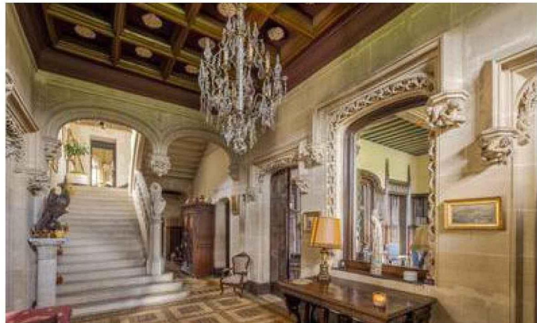
L'intérieur du château est évidemment somptueux