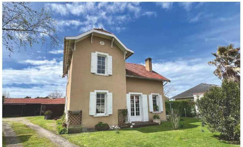
AGENCE CENTURY 21 GROUP IMMO