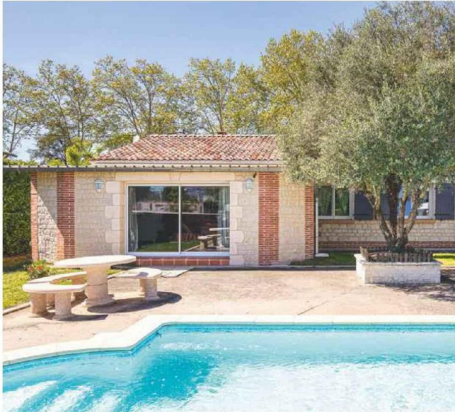
Cette maison des années 1980 située à Gaillac (Tarn) est en vente au prix de 298 000 euros. Elle offre une surface habitable de plain-pied de 125 mètres carrés.

«tout ne partant plus à n'importe quel prix», selon Julien Haussy. Une chose est certaine, vous aurez davantage de chances d'emporter la mise sur des logements présentant des défauts ou nécessitant des travaux, que vous pourrez «négocier de 10 à 20% au-dessous du prix affiché», poursuit-il.