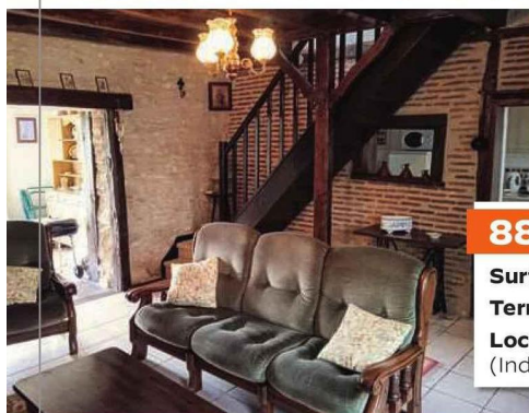
Cette maison en pierre claire, proche du parc naturel régional de la Brenne, offre deux chambres à l'étage.