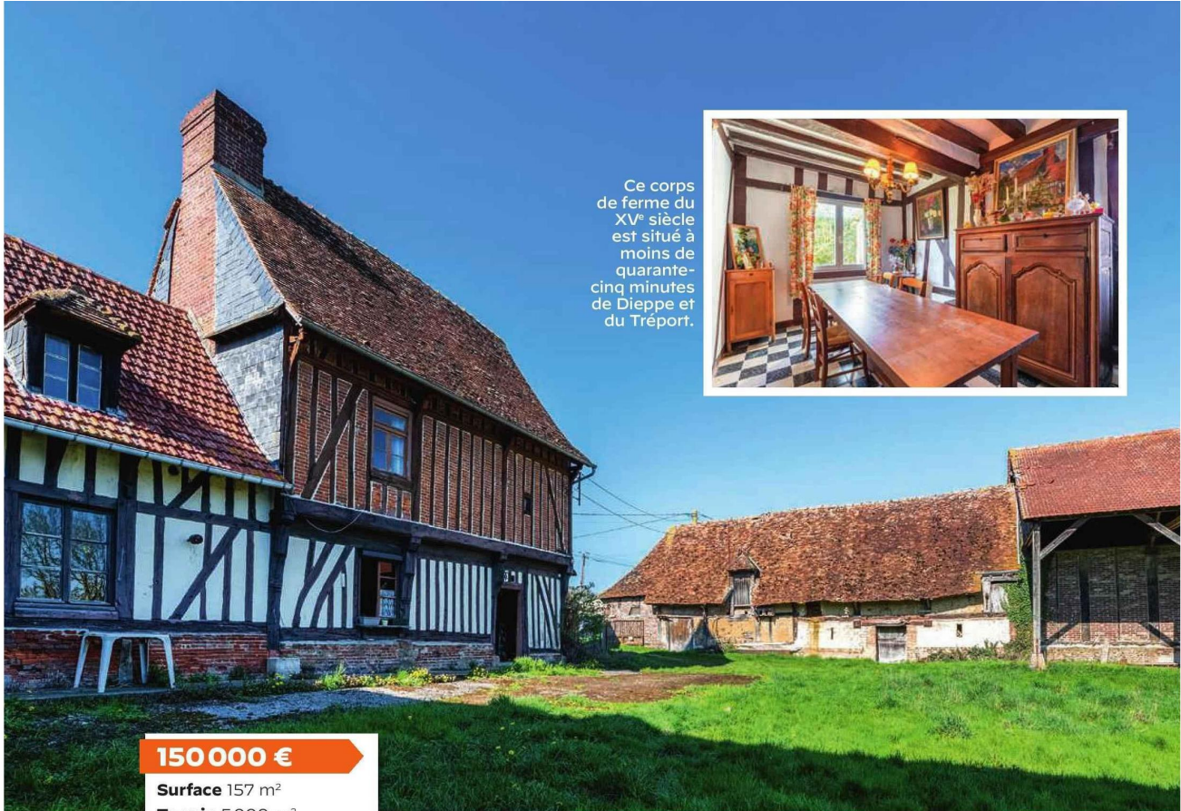
Ce corps de ferme du XV e siècle est situé à moins de quarante-cinq minutes de Dieppe et du Tréport.