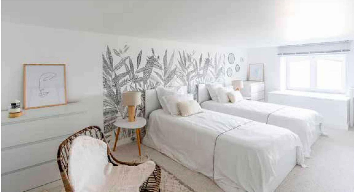
Dans la chambre à l'étage, on se prend à rêver d'ajouter un bureau. L'endroit idéal pour quelques jours de télétravail chaque semaine.

La table en marbre dénichée en Italie fait naturellement la transition vers l'espace salon. Là encore, le choix des matières a été déterminant. Le canapé Mille Et Une Nuits de Bérangère Leroy en lin lavé a été réalisé sur-mesure. « Je voulais ce design précis, qu'il soit extrêmement confortable et sans matière animale. J'ai choisi les couleurs, les matières, la forme et les dimensions. » En face, deux fauteuils Pacha signés Pierre Paulin lui répondent parfaitement. L'aspect spectaculaire est encore accentué par deux grands miroirs au très fin liseré noir, trouvés sur Internet. « Je voulais cette impression d'espace, ce reflet de la vue sur la mer et des verrières dans le miroir. »