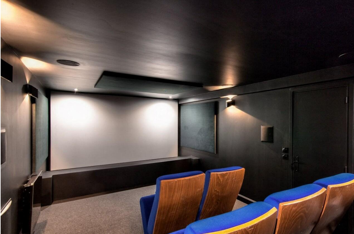
Outre les quatre chambres, le loft de 223 m 2 possède une salle de cinéma en sous-sol.