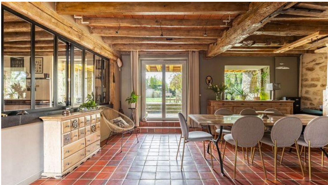
Un grand salon/salle à manger Espaces atypiques