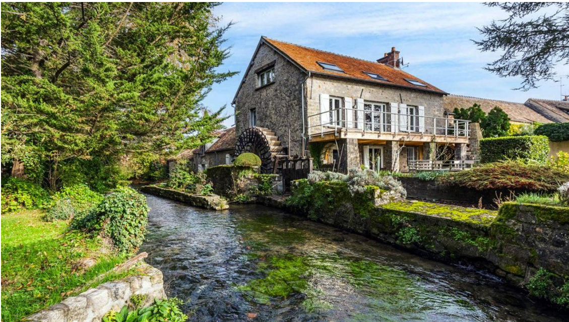
La bâtisse prend place dans un ancien moulin. (Espaces atypiques)

Cette propriété de 245 m 2 recouverte de pierres apparentes prend place dans un ancien moulin. Elle se situe en Seine-et-Marne et a été entièrement rénovée.