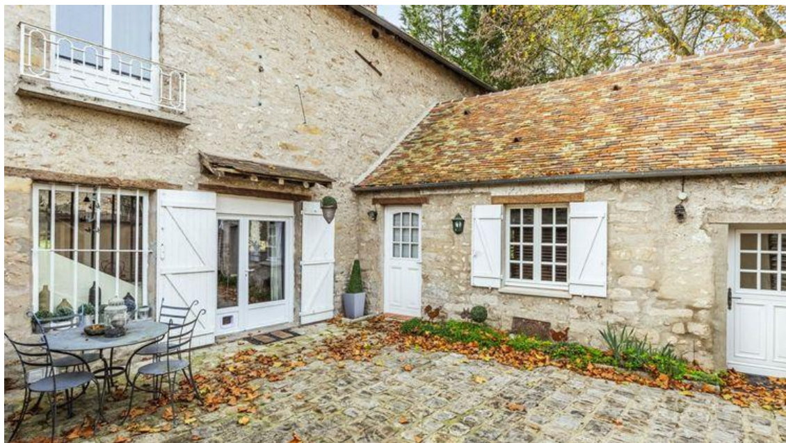
La bâtisse est ornée de pierres apparentes Espaces atypiques