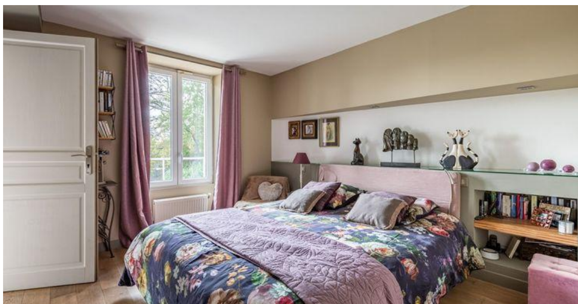
La maison comprend 4 chambres Espaces atypiques