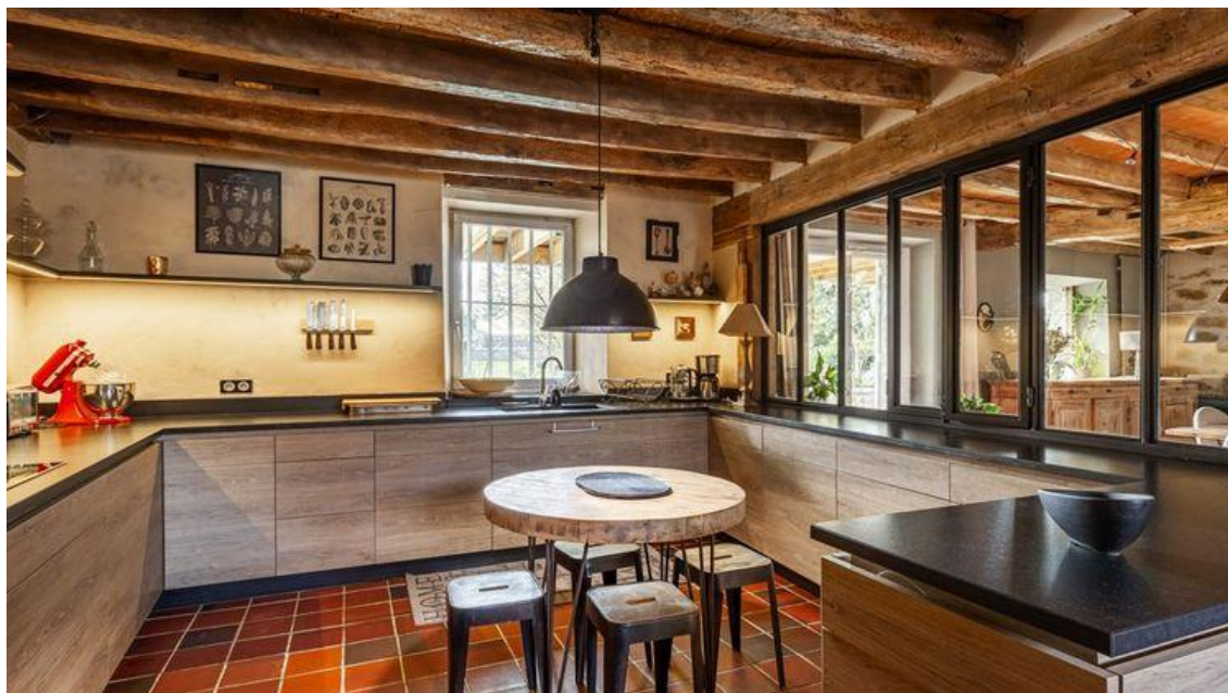
Une cuisine avec verrière alliant l'ancien et le contemporain Espaces atypiques