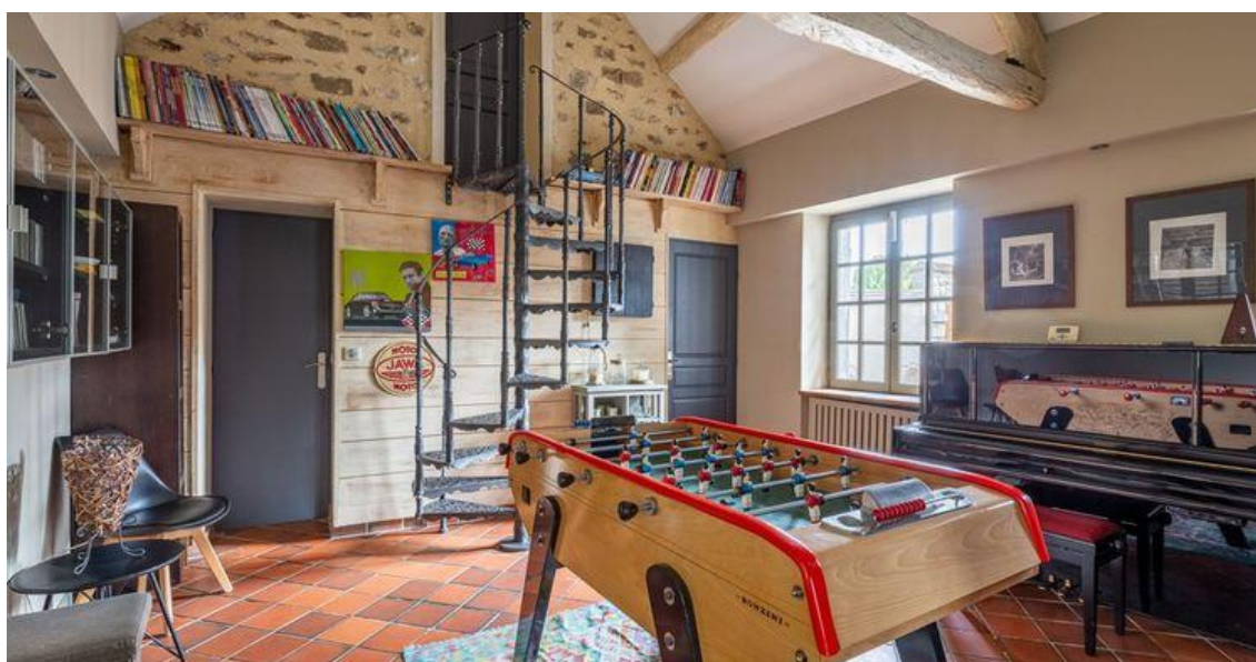
Une pièce aménagée en salle de jeux Espaces atypiques