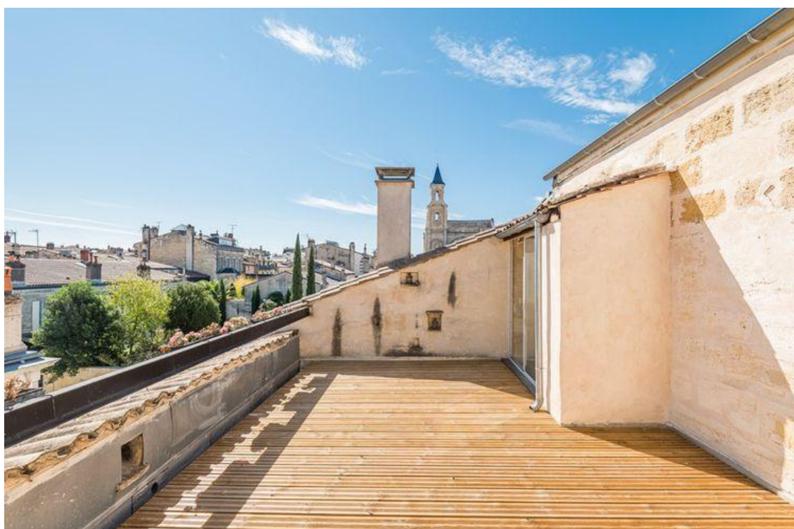
Un bien au calme absolu Espaces Atypiques