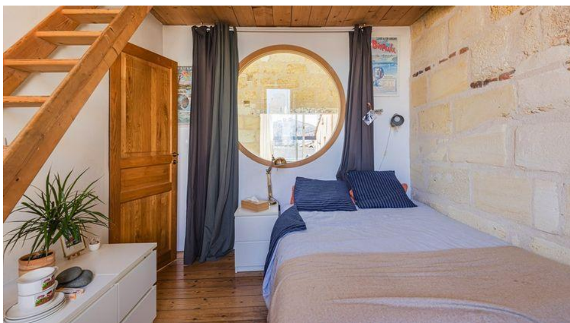
La maison dispose de 4 chambres Espaces Atypiques