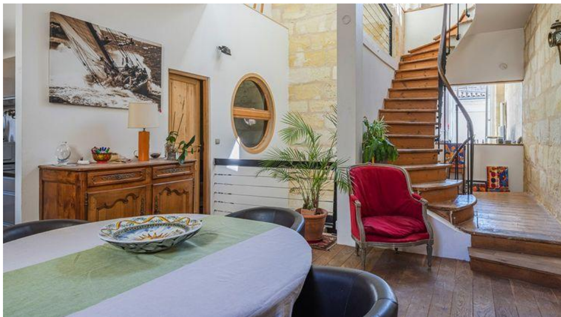
L'escalier en colimaçon mène au premier étage Espaces Atypiques