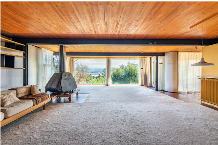
Une maison signée Jean Prouvé à vendre. © Gilbert Weyhaubt