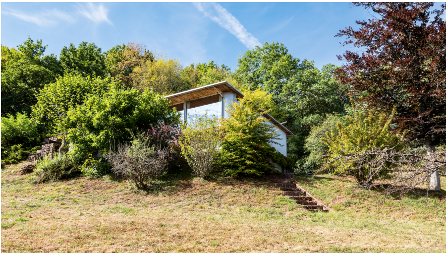
Une maison signée Jean Prouvé à vendre.