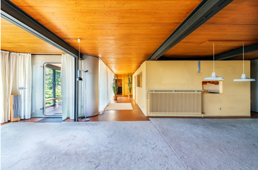
Une maison signée Jean Prouvé à vendre.