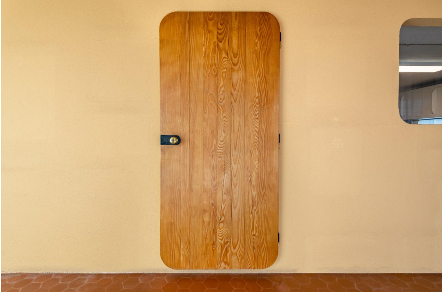
Une maison signée Jean Prouvé à vendre.