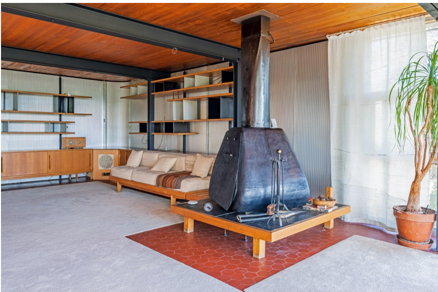
Une maison signée Jean Prouvé à vendre.