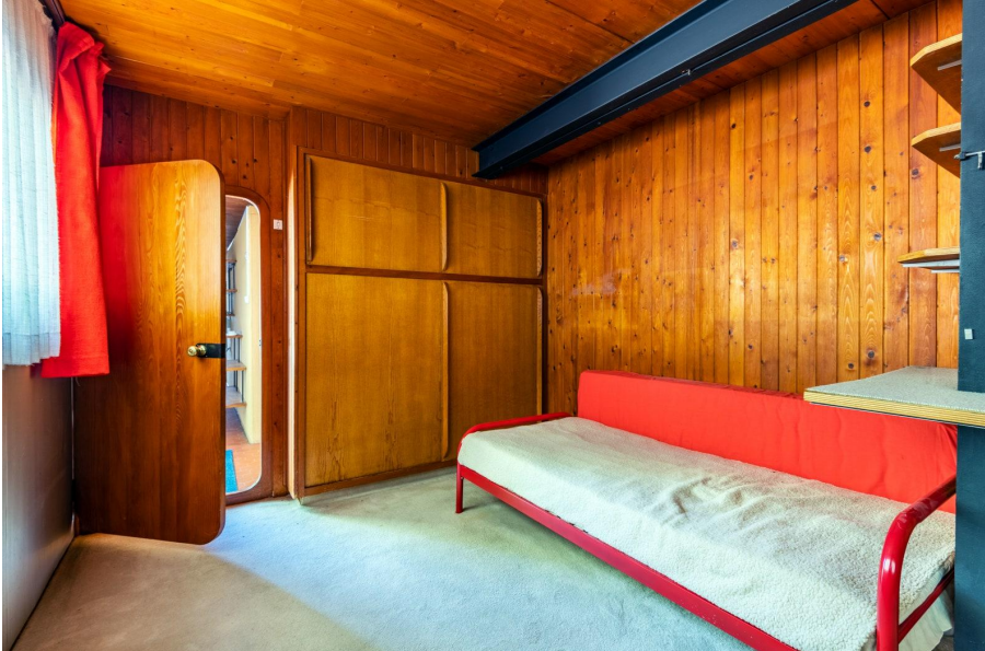
Une maison signée Jean Prouvé à vendre.© Gilbert Weyhaubt