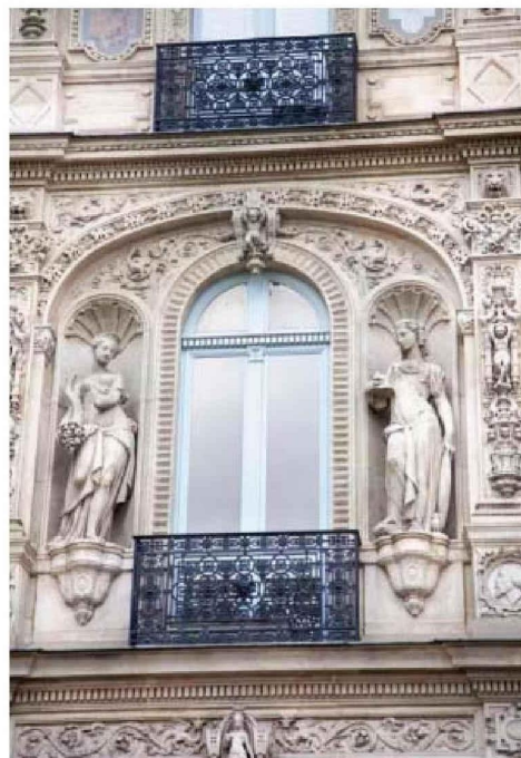
Pierres précieuses. Immeuble néo-Renaissance (1841), situé au 28, place Saint-Georges.