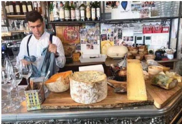
Carte postale. Au Bon Georges, un bistrot-restaurant typique du Paris canaille, prisé par les étrangers.

cachent quelques hôtels particuliers. Même envolées si l'on convoite un bien avec terrasse et sans vis-à-vis, dont le tarif peut grimper à plus de 18 000 €/m 2 . Soit des pépites vendues tout aussi cher que leurs homologues du triangle d'or avoisinant l'avenue des Champs-Élysées, ou que celles des Vosges, ou longeant les quais de Seine.