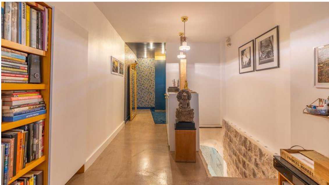
Montée d'escaliers avec pierres apparentes Espaces Atypiques