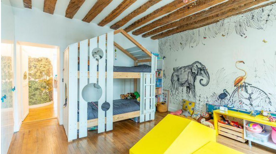
Chambre d'enfant Espaces Atypiques