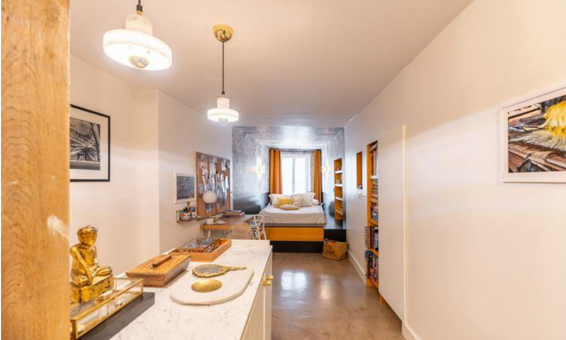
Suite parentale Espaces Atypiques