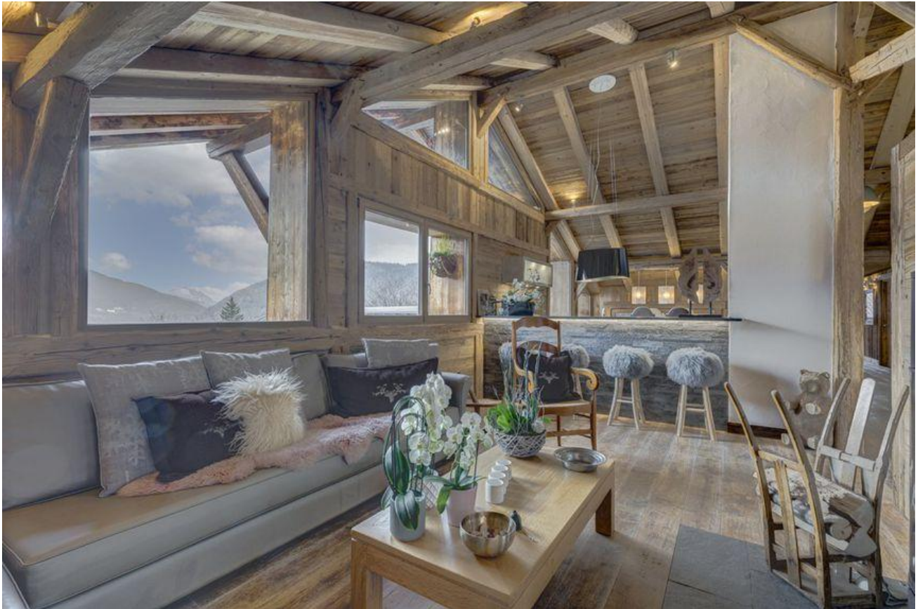
A l'étage, le second appartement a été entièrement rénové en 2016. Espaces atypiques